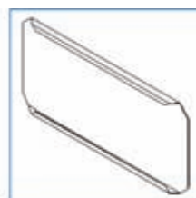
AQUAPANEL® skersinis (tipas MH)