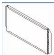
AQUAPANEL® skersinis (tipas M)